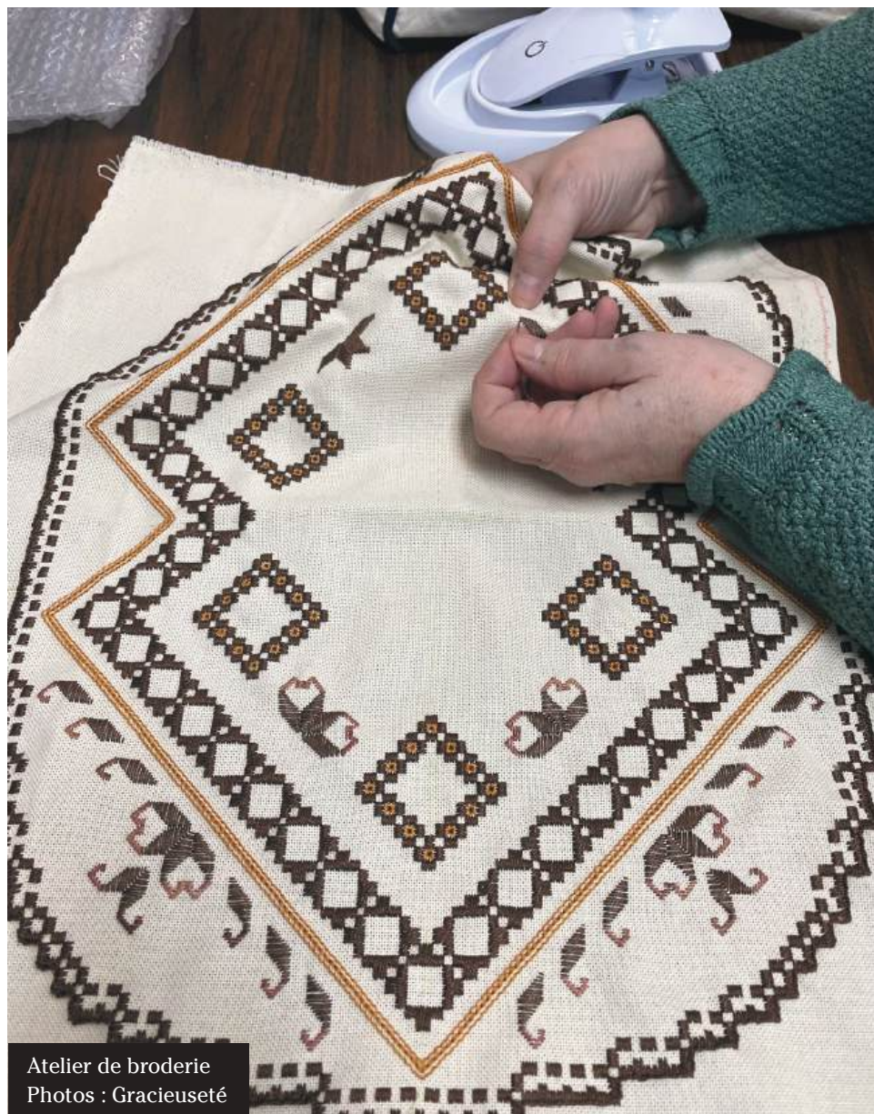
Atelier de broderie