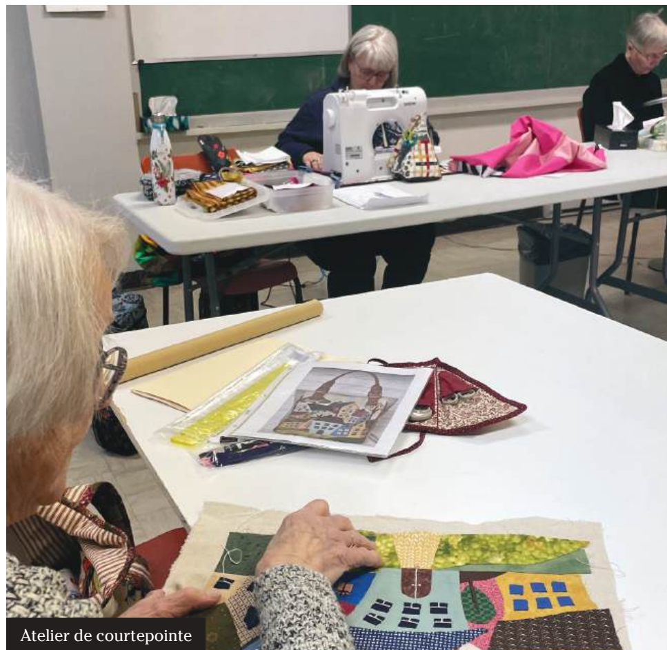
Atelier de courtepointe