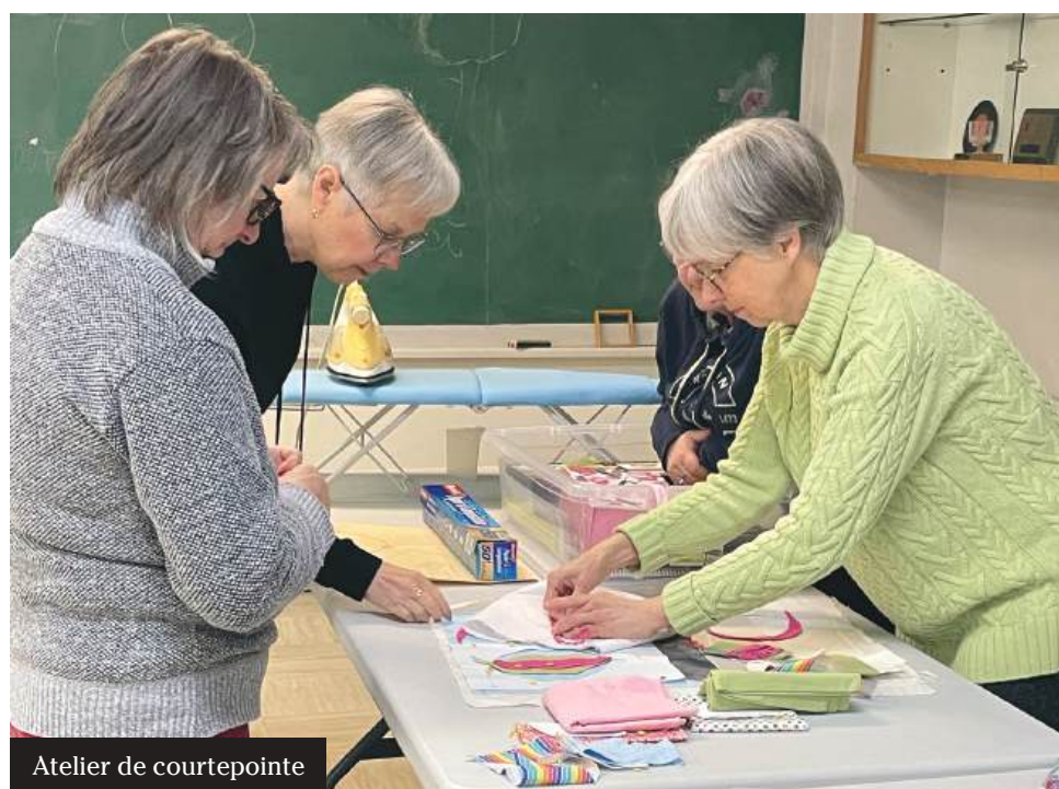
Atelier de courtepointe