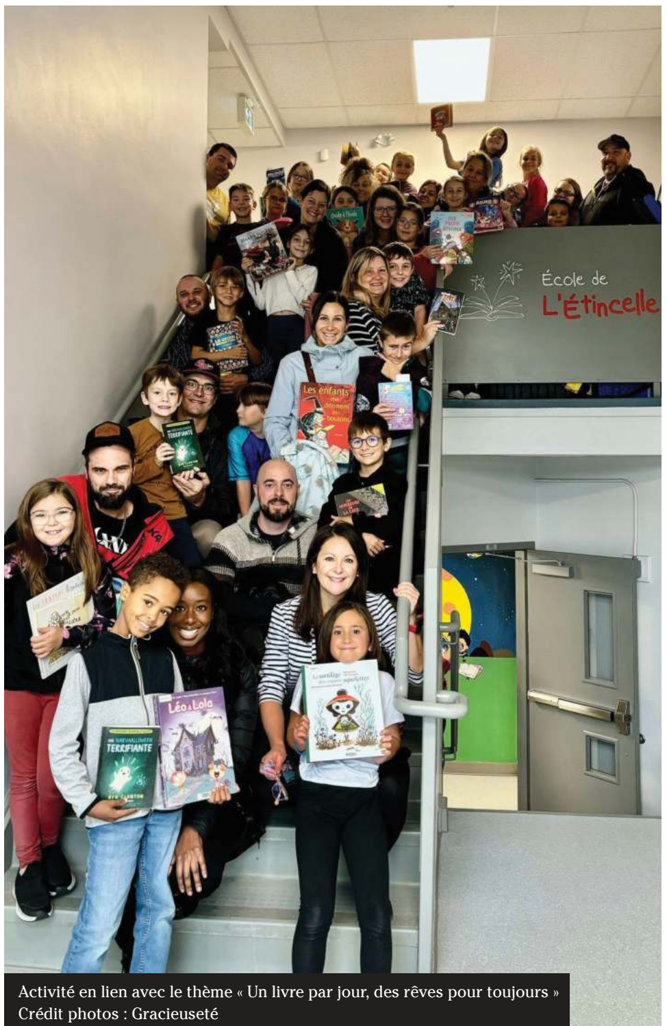
Activité en lien avec le thème « Un livre par jour, des rêves pour toujours »

Le 16 décembre est une journée de concertation, donc le marché aura lieu en après-midi, soit de 15 h 30 à 18 h 30. Ce sera animé par des élèves volontaires avec l'aide d'adultes et d'enseignants. Il y aura plusieurs types de créations, vous pourrez acheter des décorations de sapin, des cartes, des œuvres d'art et toutes sortes de belles surprises. Environ 15 classes participeront au Marché de Noël.