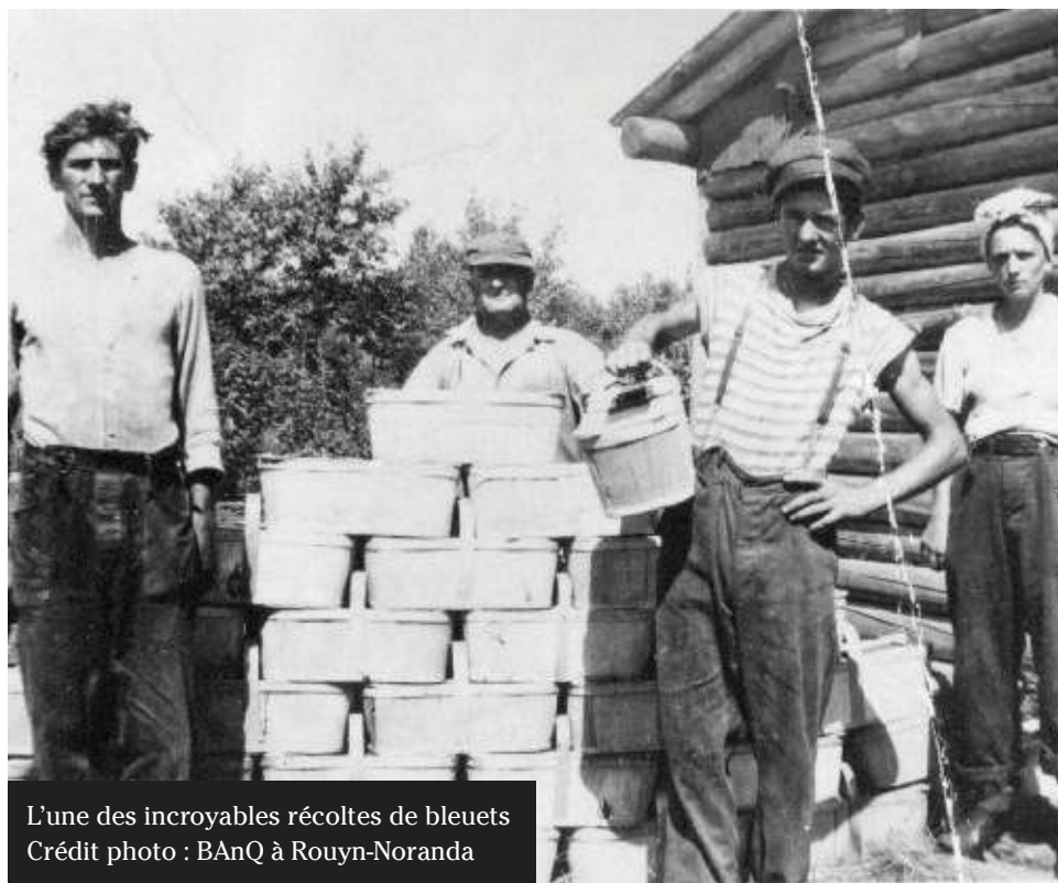
L'une des incroyables récoltes de bleuets

En plus d'apprécier la forêt présente, vous pouvez aussi contribuer à l'agrandir. Grâce au ministère des Forêts, de la Faune et des Parcs, en collaboration avec l'Association forestière de l'Abitibi-Témiscamingue, le Comité des loisirs d'Évain (CLÉ) offrira à la population, le 28 mai prochain, de petits arbres gratuitement ! C'est l'occasion d'ajouter de la nature à votre chez-vous tout en valorisant ces majestueux végétaux !