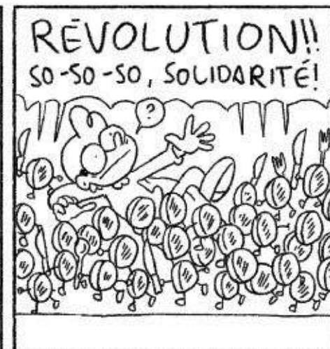
Par Yves Bourgelas!