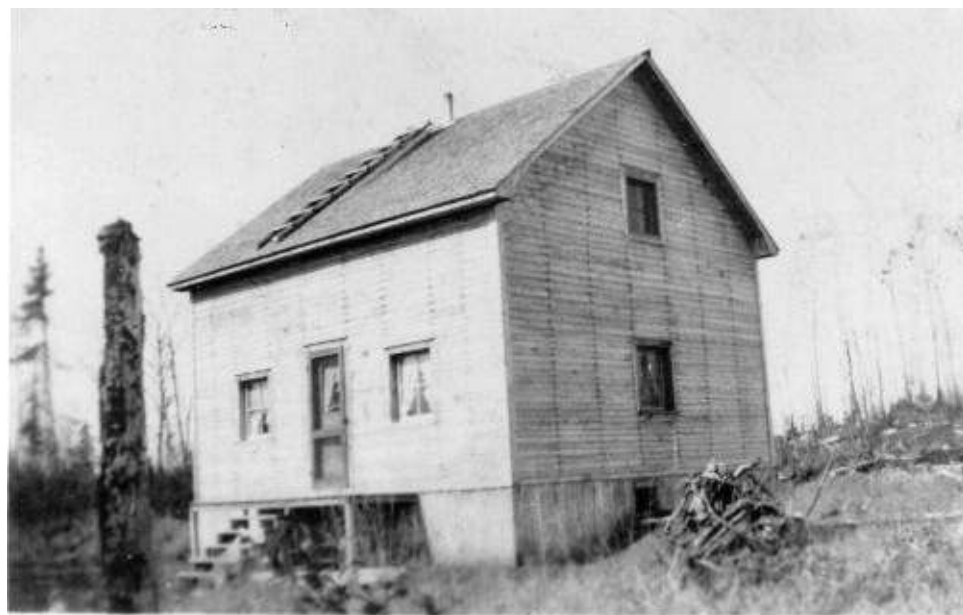
Maison coloniale de 1937. On remarque en arrière-plan les chicots, restes du feu de forêt de 1932

C'est donc dans une quasi-absence de forêt qu'Évain se développe. Les cendres offriront tout de même le milieu idéal pour les bleuets, dont les récoltes seront fabuleuses, et aideront à l'implantation agricole. Quant à la construction, mis à part les maisons du rang 10 (du Lac-Flavrian) dont les lots contenaient encore des arbres, le bois nécessaire sera importé des alentours.