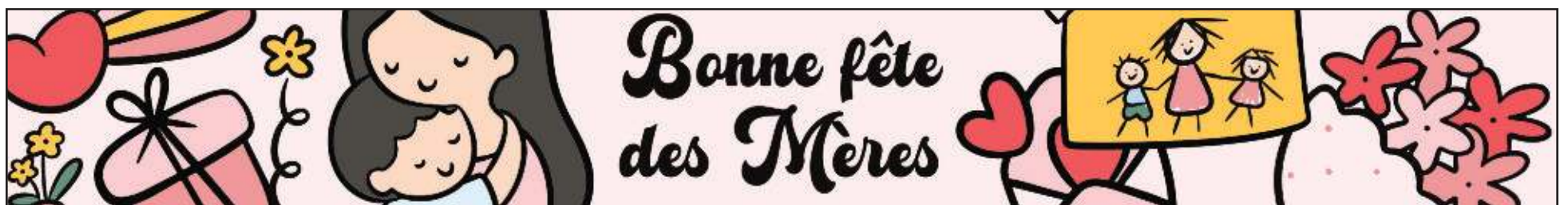
Article en page 3